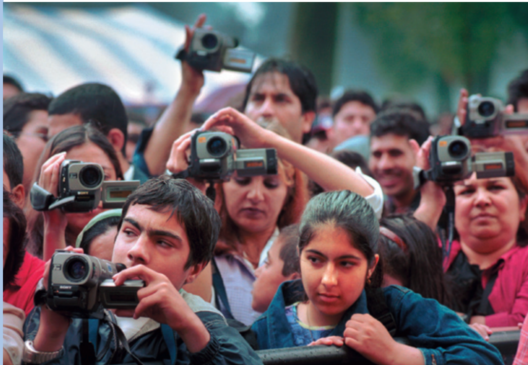
Vluchtelingen filmen een optreden tijdens een festival

De journalistiek is lange tijd een wit bolwerk geweest waar migranten maar moeilijk toegang toe hadden. Daar begint langzaam verandering in te komen. Namen van Surinaamse, Turkse en Marokkaanse journalisten beginnen heel geleidelijk de colofons van dagbladen en tijdschriften te vullen, en bladen als het Marokkaanse M'zine en Sen van de Turkse Senay Özdemir openen de weg voor andere journalisten met een niet Nederlandse achtergrond. De TV en radio zijn al wat langer aan het verkleuren, en niet alleen aan de 'voorkant'. Natuurlijk zijn presentatoren als Prem, Rayman of Samira Abbas het meest zichtbaar, maar op de aftiteling van de programma's verschijnen ook steeds vaker niet Nederlands klinkende namen van mensen die achter de schermen werken. Het aandeel dat vluchtelingen hebben in de interculturalisatie van de media lijkt op het eerste gezicht echter klein te zijn. Dat is opvallend, omdat een relatief grote groep vluchtelingen in hun eigen land actief was in de media. Niet zelden maakten juist hun journalistieke werkzaamheden dat zij moesten vluchten.